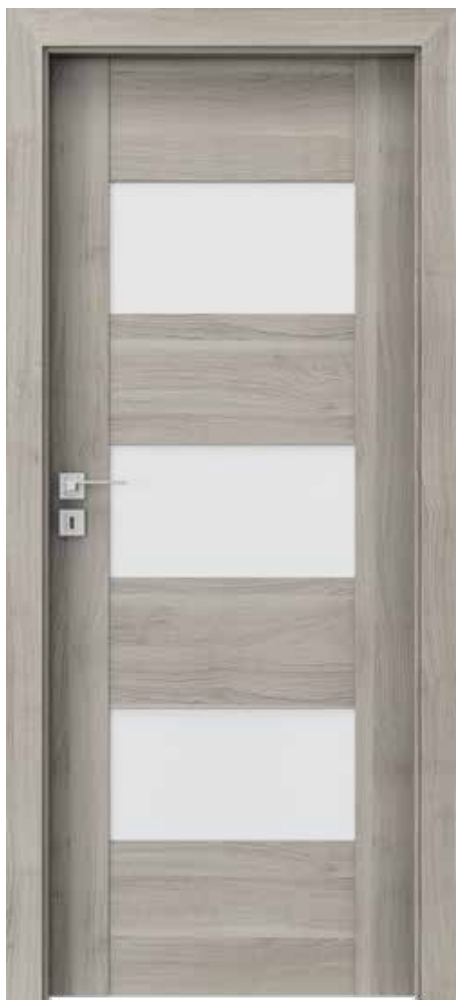
Porta KONCEPT K.3, Agát Strieborný