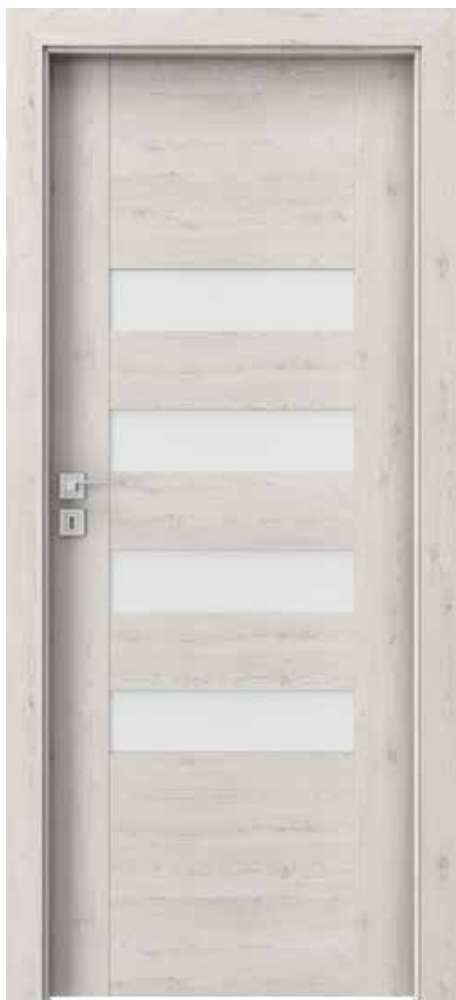
Porta KONCEPT H.4, Borovica Nórska