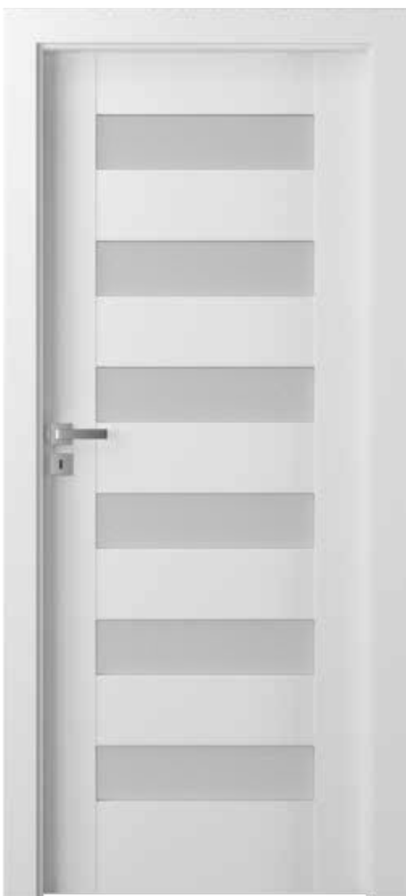
Porta KONCEPT C.6, Biela